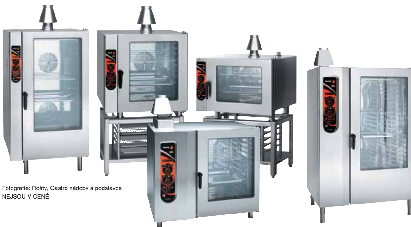
Fotografie: Rošty, Gastro nádoby a podstavce NEJSOU V CENĚ