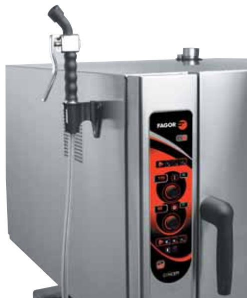
SK-10 Závěsná vnější sprcha

(Ostatní modely jsou vybaveny sprchou samonavíjecí).