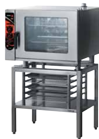
Konvektomat COE-061 na podstavci SH-1011 s lištami na GN-1/1