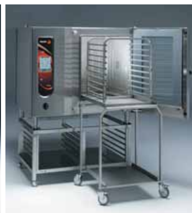
VPE-102 s podstavcem SH-21-G , klecí EB-1021 , a stolem CP-1021 s pojezdem GE-1021