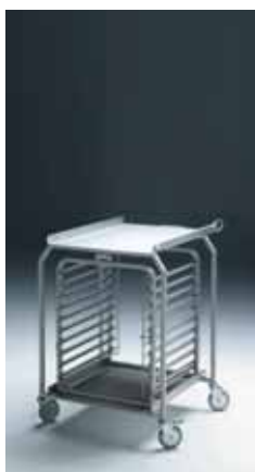
Klec EB-1021 ve stole CP-1021