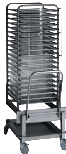
Zavážecí vozík s integrovanou klecí CEB-2021 pro konvektomaty 202