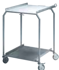
Zavážecí stůl CP-1021