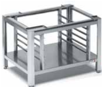
Podstavec SH-1011 s vodícími lištami na GN -1/1

Vyrobeny z nerezové oceli. Vodící lišty pro GN jsou součástí podstavců