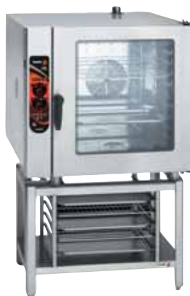
Konvektomat COE-101 na podstavci SH-1011 s lištami na GN-1/1