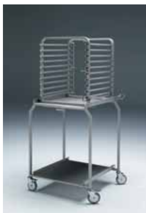
Zavážecí stůl CP-1021 s klecí EB-1021