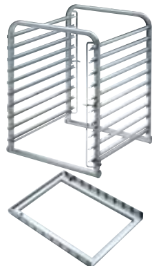
(*) Klec EB-1021 a pojezdový rám GE-10/21 pro konvektomaty 102

Klece na GN EH-10/11 a EB-1021 : vyžadují pojezdový rám GE-10/21 umístěný na dně komory (*)