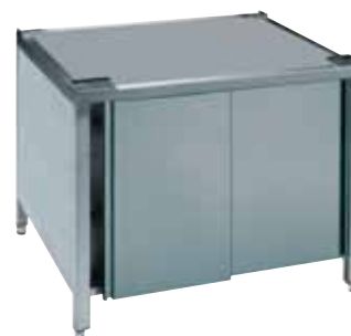
Skříň – podstavec ANH-611